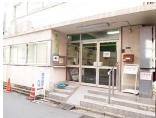
本館：東京学院ビル